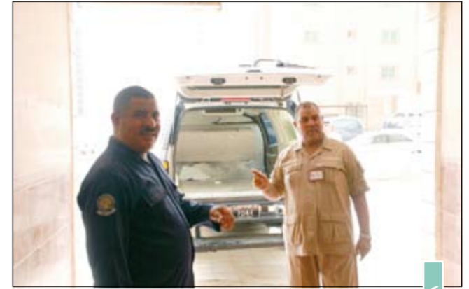
رجال الأمن يتجولون حول البناية