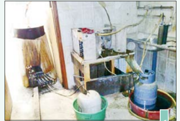
كيفية تصنيع الخمر في «الجراكل»