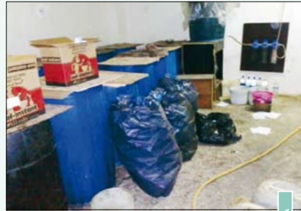
الأكياس معبأة بالخمر المحلي