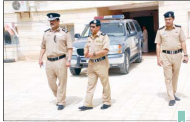
اللواء طارق حمادة في موقع الجريمة