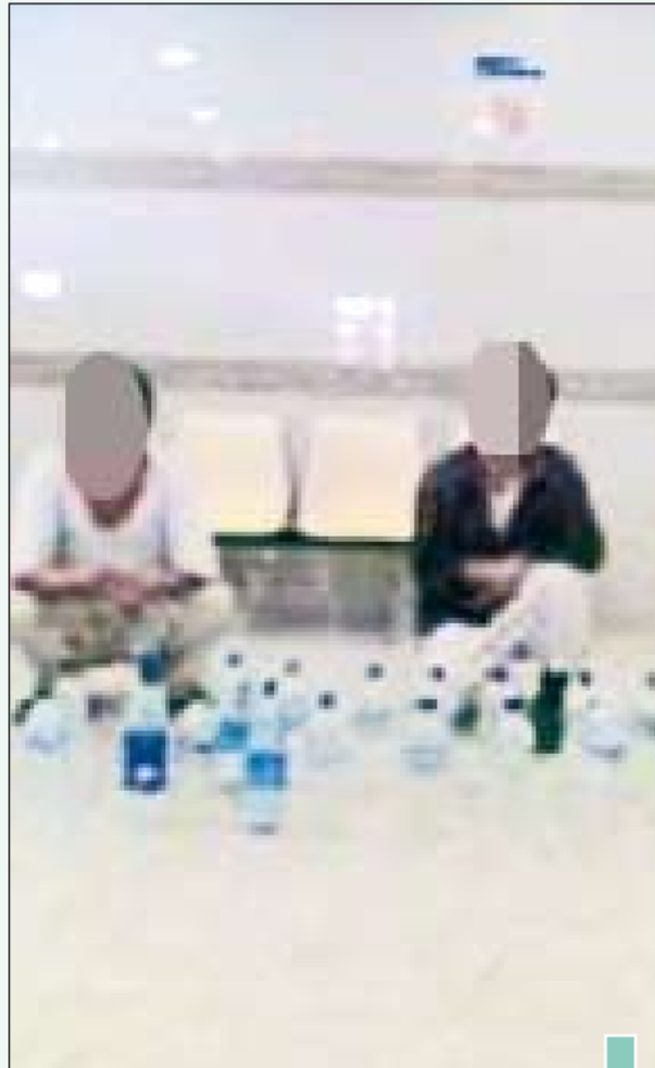
المتهمان وامامهما المضبوطات