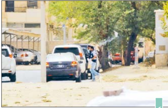
رجال الأدلة ينظرون الجثة لرفعها للمطب الشرعي