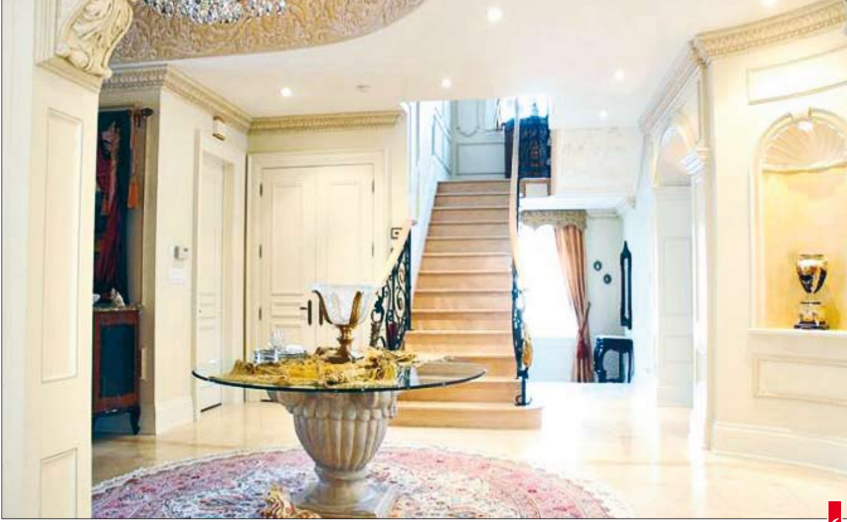
لمسة من الفخامة