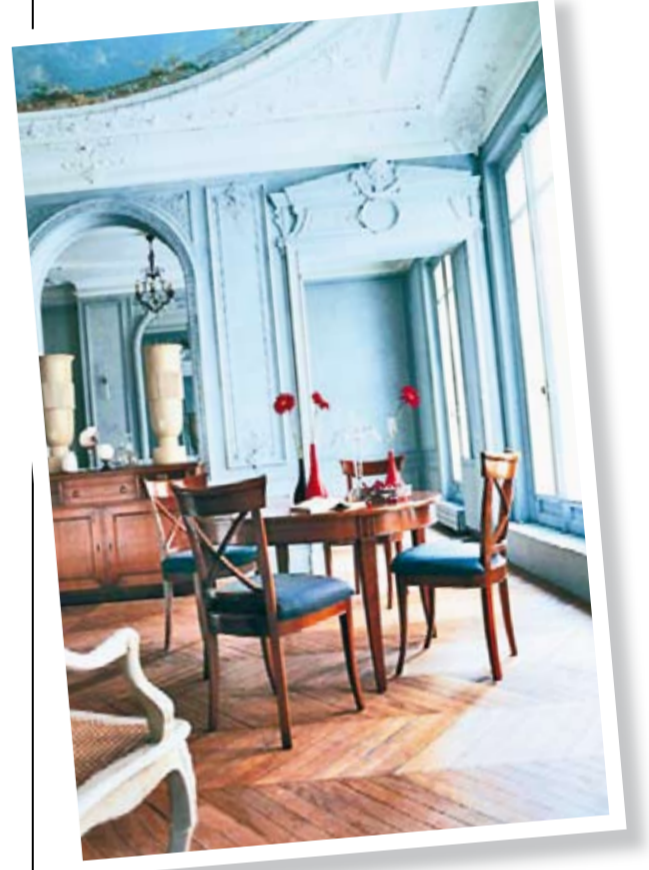
لمسة من الفخامة

مثل غيره من المواد الطبيعية، شهد «الجبس» عبر تاريخه الطويل، موجات هبوط وصعود.. على أن المرحلة العربية في الأندلس تبقى الأخصب إذ وصل استخدامه في العمارة والديكور إلى الذروة كبدل للحجارة والأخشاب.. وفي الثلاثينات من القرن التاسع عشر عرف الجبس مرحلة ازدهار كبيرة بعد شيوع ما يسمى طراز «نابليون الثالث».. فاكتملت صفة النبل خصوصاً بعدما أخذ في الظهور داخل البيوت البرجوازية ومدائل العمارات الراقية. غير أن تراجعاً ملحوظاً شهده الجبس بعد الحرب العالمية الثانية، وعلى الأخص في الستينيات، مع بدء شيوع أنماط جديدة من الديكورات والفنون الزخرفية وظهور تيارات فنية حديثة. لكن هذا التراجع لم يستمر طويلاً، ذلك أنه دفع بالعاملين في هذا المجال إلى ابتكار نماذج جديدة من الزخرفة تنسجم مع ذوق العصر الجديد وميوله، كما طوروا أسلوب صناعة الجبس مما جعله أكثر صلابة وجمالاً ونعومة عند اللمس، وهذا ما أدى به إلى أن يفرض نفسه كعنصر زخرفي يتماشى مع كل تيار كلاسيكياً كان أو عصرياً.