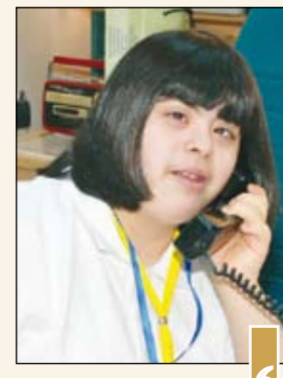
سارة مأمورة بدالة

ان مجموعة من الأبناء رأى اولياء امورهم ان تكون فترة التدريب مساندة فهناك مجموعة تعمل مساء في عدد من المراكز. وتوجهت العلي بالشكر للمجلس الأعلى لشؤون المعاقين على الثقة الموجهة لمجموعة شباب الخير التطوعية، لنقمتهم في منحهم مسؤولية الإشراف على تنفيذ البرنامج الخاص بدمج المعاقين داخل المؤسسات الحكومية والأهلية. وطالبت العلي الجهات التي يعمل بها ابناؤنا المعاقون بتبنيهم المعاقين في أعمالهم بعد ما لمسوا من قدرات لديهم على العطاء.