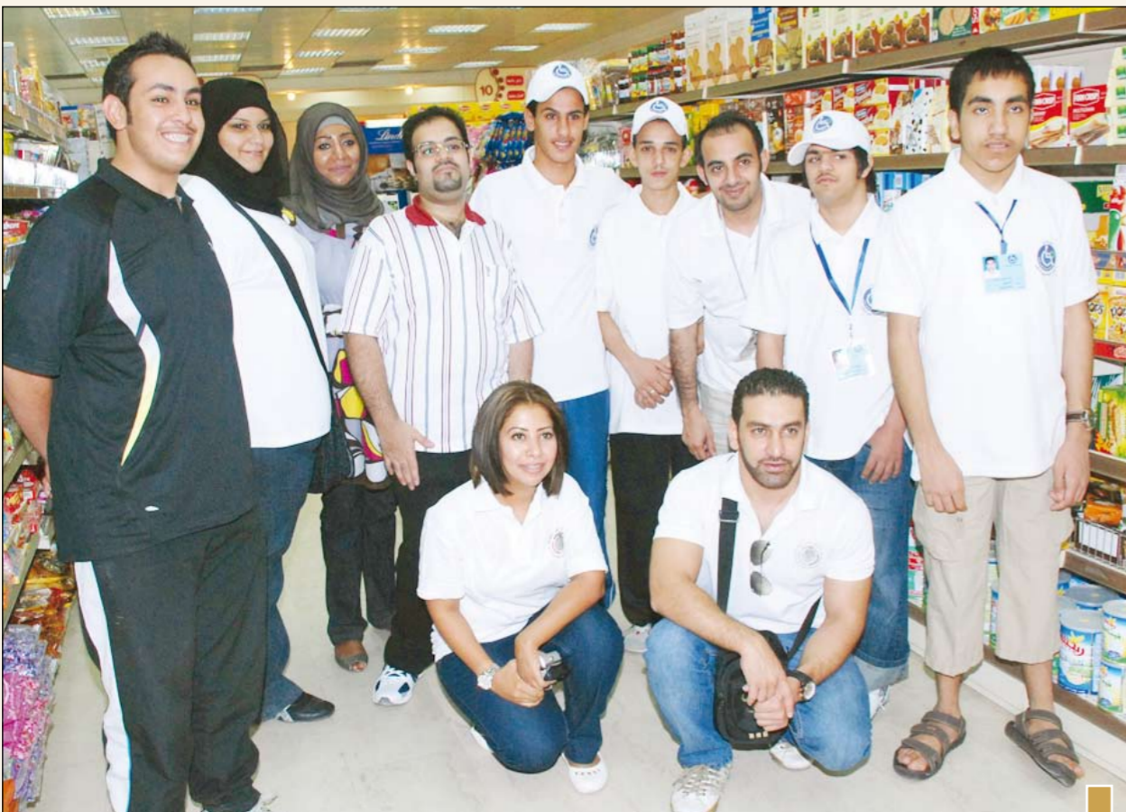
فريق العمل التطوعي

العمل في مختلف الأقسام بالفترة الصباحية لإكسابهم الخبرات العملية