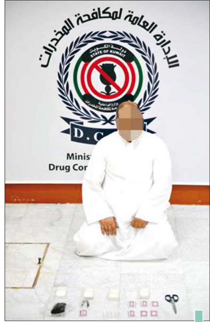
المتهم وامامه المضبوطات