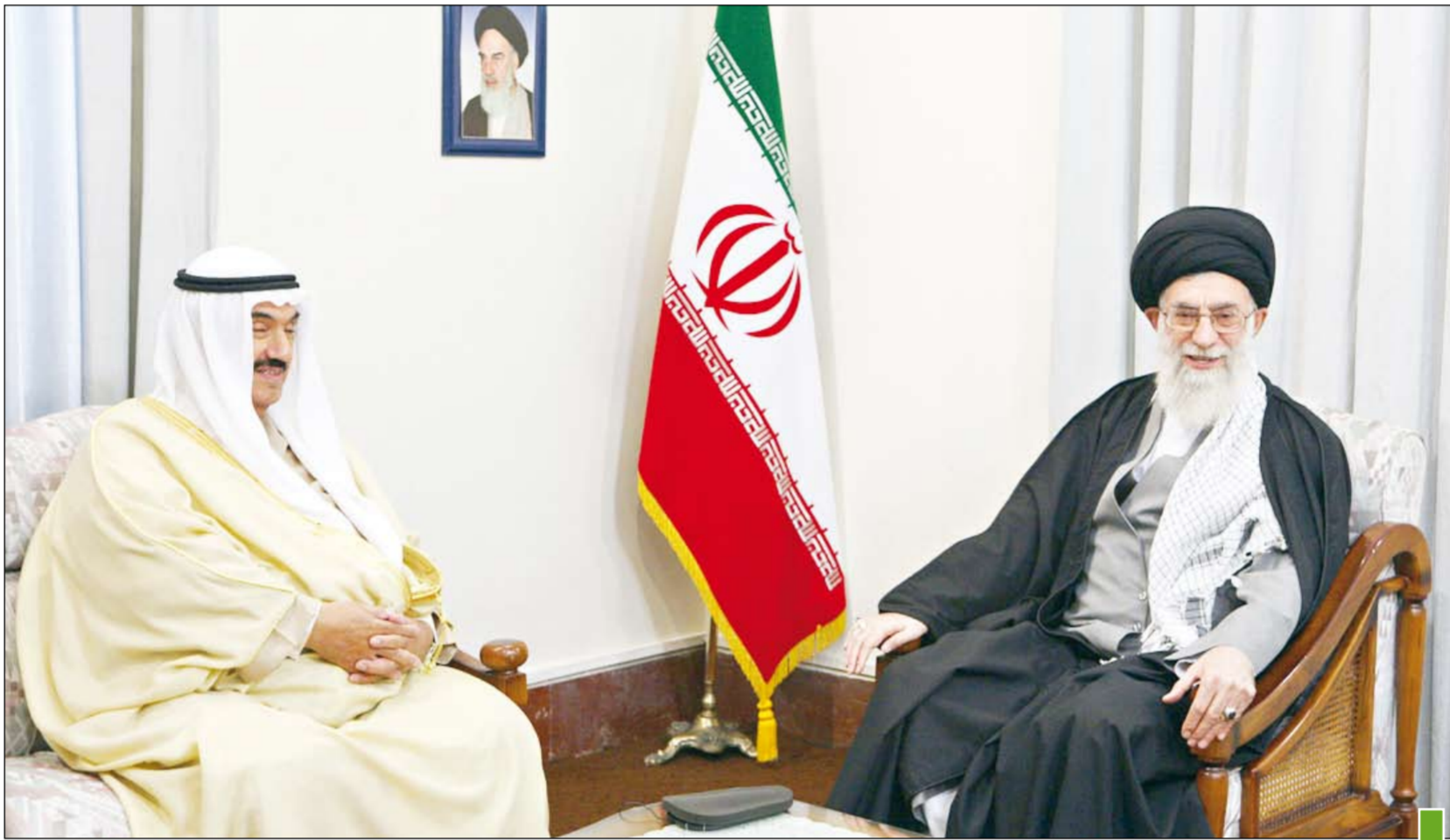
الشيخ ناصر محمد خلال لقائه المرشد الأعلى الإمام السيد علي خامنئي